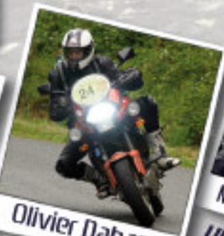
Olivier Dahan merci d'avoir osé cette épreuve...